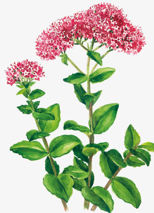
Fabària, Sedum telephium